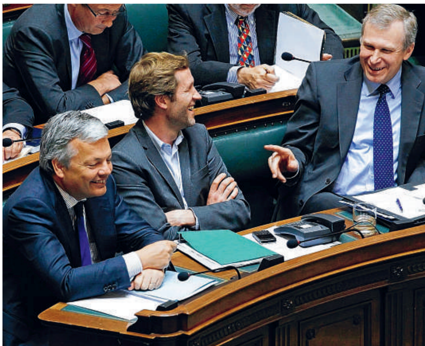
Premier Yves Leterme en zijn regeringsleden Didier Reynders (l.) en Paul Magnette (m.) kregen van de oppositie het verwijt voor Electrabel te rijden.

Dat is ook de mening van Agoria, de federatie van de technologische industrie. Die richtte gisteren haar pijlen wel vooral op de hoge energieprijzen. Die zorgen ervoor dat de inflatie hier hoger ligt dan in de buurlanden. Agoria heeft twee voorstellen om daar iets aan te doen. Het eerste is om ook voor de gasprijzen een omgekeerde cliquet in te voeren. Dat al voor benzine en diesel gehanteerde systeem remt prijsstijgingen af door tegelijk de belastingen op dat energieproduct wat te laten zakken. Daarnaast pleit de federatie ervoor een deel van de inkomsten uit de nucleaire rente te gebruiken om de federale bijdrage op elektriciteit te verlagen. IB